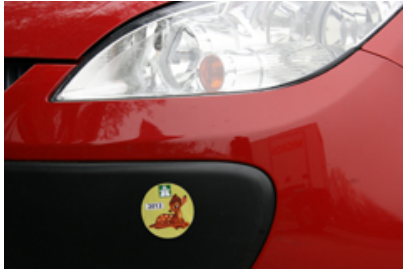
Vignette ' Bambi ' : protection de la faune sauvage et bonus pour les conducteurs de grosses cylindrées.

Les ministres de l'environnement et des transports réunis à la XIème Conférence alpine à Brdo/SI à la mi-mars ont adopté une nouvelle taxe sur la circulation, non liée aux prestations. A compter du 1er janvier 2012, la vignette " Bambi " sera requise sur toutes les routes des Alpes.