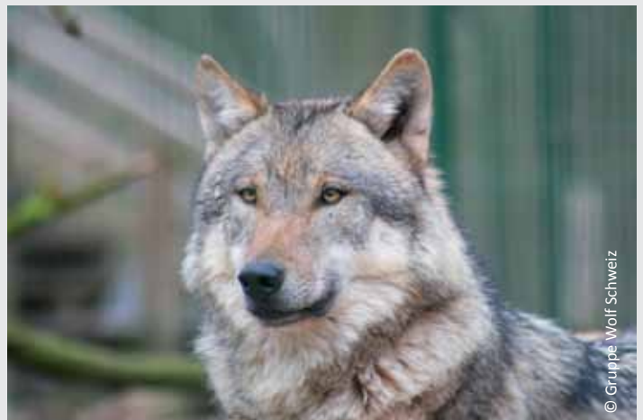
In den Alpen ist der Wolf wieder heimisch geworden. Eine breite Akzeptanz wird u.a. davon abhängen, ob es die Gesellschaft schafft, den Umgang mit dem Wolf wieder zu erlernen.

Dabei sei auch davon auszugehen, dass die Gesellschaft in den Alpen einen natürlichen Umgang mit dem Wolf erst wieder erlernen müsse. „Dazu braucht es auch etwas politischen Mut der Führungskräfte der Alpenländer anstatt der nur allzu oft anzutreffenden polemischen Auseinandersetzung mit dem Thema.“ Die ALPARC-Stellungnahme