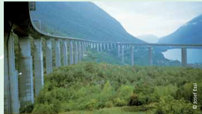
In regelmäßigen Abständen wird aus dem Belluno und Veneto der Weiterbau der Alemagna gefordert. Jetzt über die Hintertür der EUSALP.

Jahre 1968. Im damals forcierten Projekt sollte die Alemagna-Autobahn durch das Tauferer Ahrntal nördlich von Bruneck führen. Berichtet wurde von der bevorstehenden Gründung eines Talschaftsausschusses „zur Wahrnehmung der