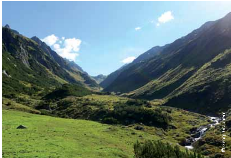
Das Gaflunatal ist ein prädestinierter Gebirgsraum für die Ausweisung einer Weißzone.

Sowohl bei der Weißzone als auch bei der Alpenkonvention ist dieser fachübergreifende Ansatz eine Stärke. Im Span-