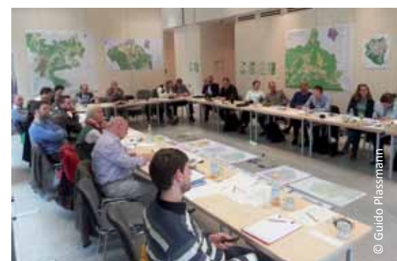
Neben dem Thema „Ökologischer Verbund“, sind eine innovative Regionalentwicklung und eine hohe Lebensqualität weitere wichtige Arbeitsfelder von ALPARC.

Natur wieder zu beleben. Die wichtige Rolle der Schutzgebiete für den Schutz und die Entwicklung des Natur- und Kulturerbes der Alpen sowie für die Sensi-