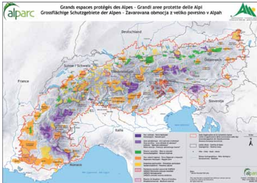
Das umfassende Schutzgebietsnetzwerk reicht von Monaco bis vor die Tore Wiens. Es ist eine wichtige Austauschplattform und ein Beitrag zur Umsetzung der Alpenkonvention.

Bei den Gesprächsrunden kristallisierte sich vor allem eine Erwartung heraus: Die Schutzgebiete in den Alpen müssen durch Kommunikation und Sensibilisierung einen wichtigen Beitrag leisten, um die Verbindung zwischen Mensch und