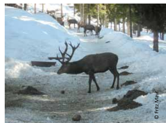
Um dem Bergwaldprotokoll zu entsprechen, sind laut Rechnungshof u.a. auch Wildstandsregulierungen vorzunehmen.

Hinsichtlich des Bergwaldprotokolls hielt das Bundesministerium für Land- und