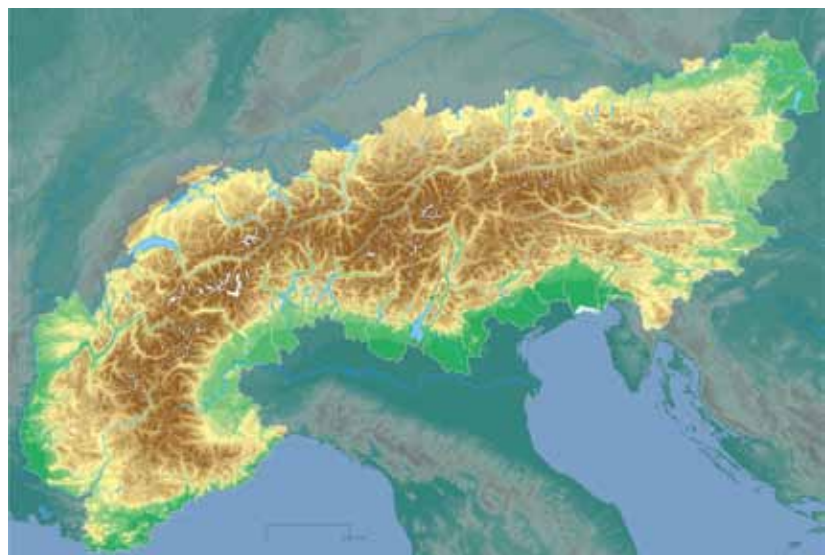
Für die die Bayerischen Grünen müssen die Alpenkonvention und die Inhalte der Durchführungsprotokolle Grundlage der EUSALP sein.

Akteure in Österreich.“ Erwähnt wird in diesem Zusammenhang auch das 2013 und 2014 von CIPRA Österreich durch-