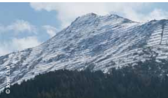
Technische Verbauungen sind nicht nur ein schwerer Eingriff in die Landschaft und das Landschaftsbild, sie verursachen auch enorme Kosten.

Verbesserung des Schutzwaldes mehr als 90 Jahre dauern.