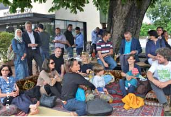
Um unterschiedliche Kulturen in den Alpengemeinden zu integrieren, benötigt es vor allem ein Bindeglied als Ansprechstelle sowie eine aktive Kommunikation.

tion wird unterstützt durch gemeinsame Projekte – kleine und große, auch gemeindeübergreifend. Vor allem Essen und Musik werden als Bindeglied zwischen den Kulturen gesehen. Beispiele: