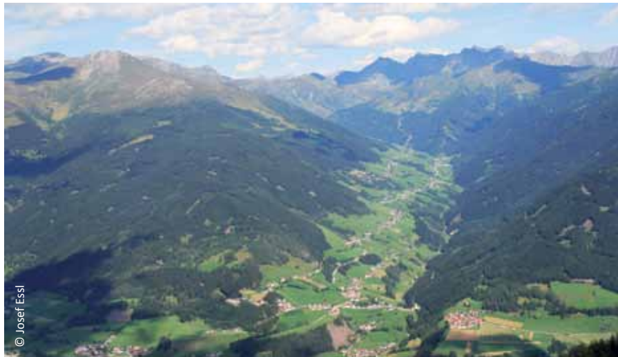
Ein intakter und gesunder Bergwald ist der größtmögliche Schutz für Täler und Orte vor Naturgefahren (im Bild das Navistal/T).

Das Land Vorarlberg teilte mit, dass mit dem Jagdgesetz 1988 der Waldzustand in den Mittelpunkt des Jagdgesetzes ge-