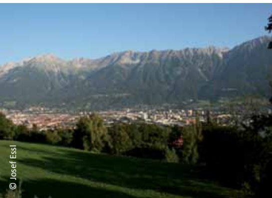
Der 60. Ständige Ausschuss fand in der Alpenkonventionsstadt Innsbruck statt.

Nachdem es unter italienischem Vorsitz keine Sitzung des Ständigen Ausschusses am Sitz des Ständigen Sekretariats in Innsbruck gab, hat der aktuelle deutsche